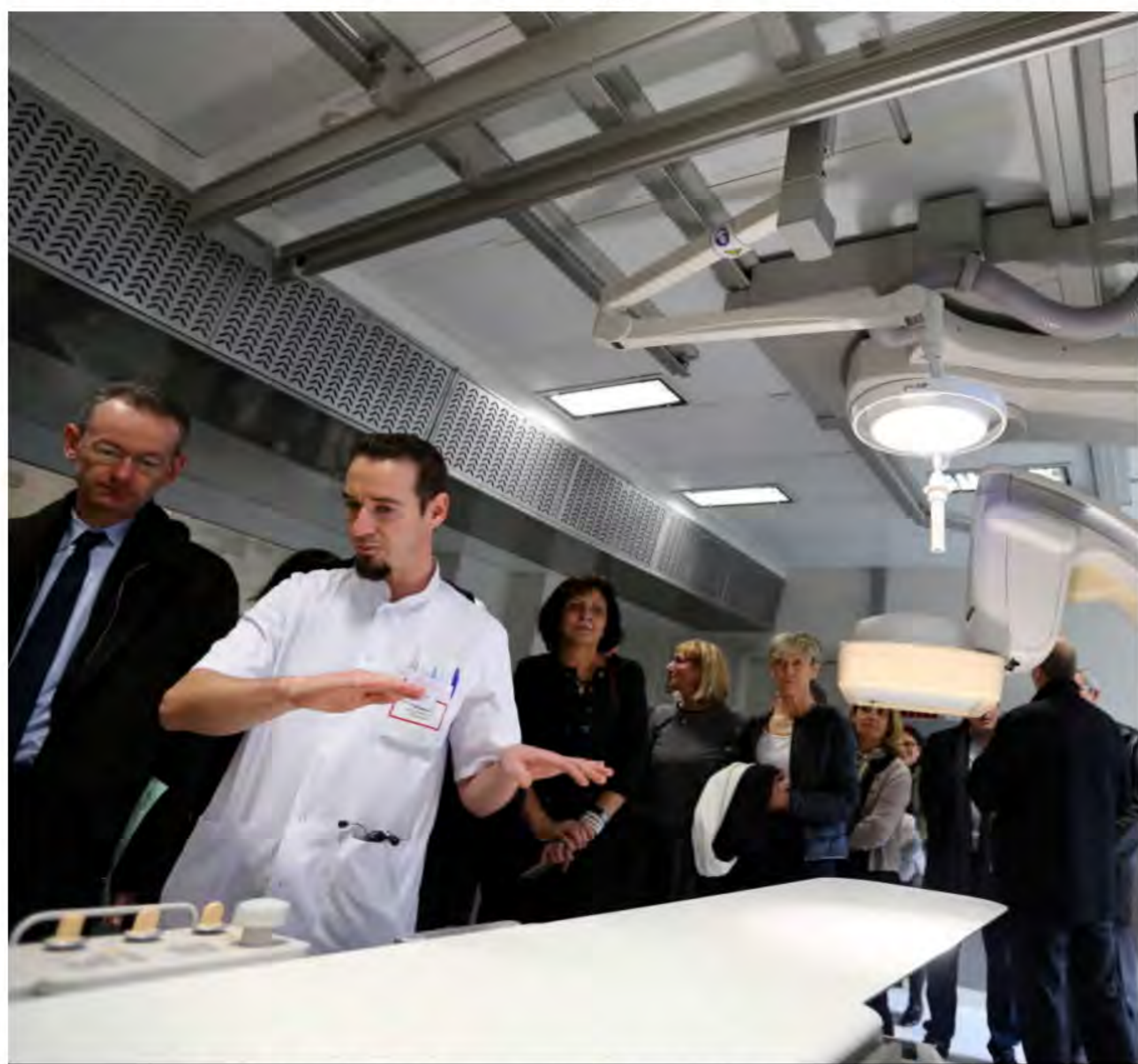
La salle de rythmologie, toute neuve, est équipée de matériels de pointe.